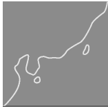
图 1.2 大珠江三角洲地区的主要行政辖区